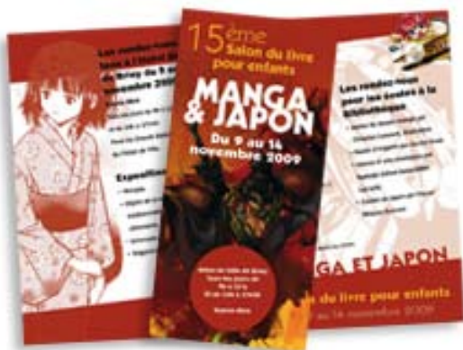
Plaquette pour le Salon du Livre Bibliothèque de Briey (57)

A l'occasion du Salon du Livre de Briey, conception d'un dépliant 3 volets sur la base de la charte graphique de notre exposition sur Les Mangas.