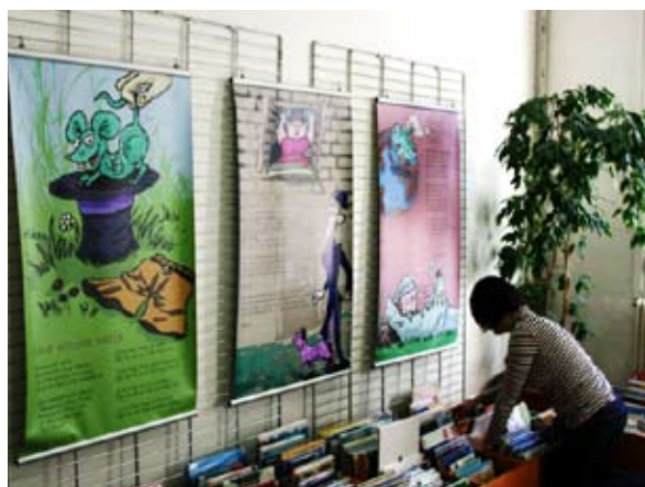
Les Comptines Médiathèque de Tours (37)