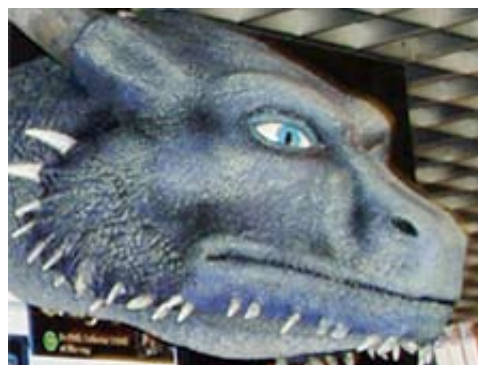
Sculpture du dragon d' Eragon FNAC de Metz (57)

Sculpture du dragon du film Eragon commandée par la FNAC de Metz pour décorer un stand à l'occasion de la sortie en DVD. Projet validé par la maison de production Twenty Century Fox.