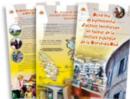
Exposition sur la BDP de Corse BDP Corse du Sud (2A)

Exposition professionnelle de 6 panneaux pour promouvoir les missions et les actions de la Bibliothèque Départementale de Prêt de Corse du Sud