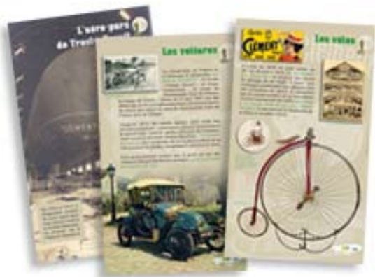
Exposition sur l'industriel Clément-Bayard Mairie de Trosly-Breuil (60)

Commande de la Mairie de Trosly-Breuil et de la Communauté de Communes de l'Oise d'une exposition de 12 panneaux retraçant les grandes inventions de l'industriel et constructeur automobile Adolphe Clément-Bayard (1855-1928)