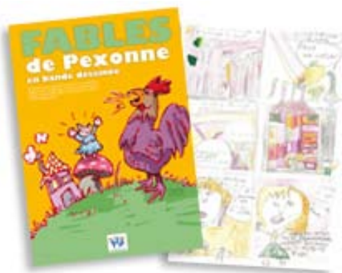
Atelier BD et réalisation d'une BD Centre "La Combelle" de Pexonne (54)

Co-réalisation entre un scénariste et un dessinateur d'ateliers de Bande Dessinée pour des scolaires en classe verte sur le thème des Fables. Projet à l'initiative des PEP de Lorraine.