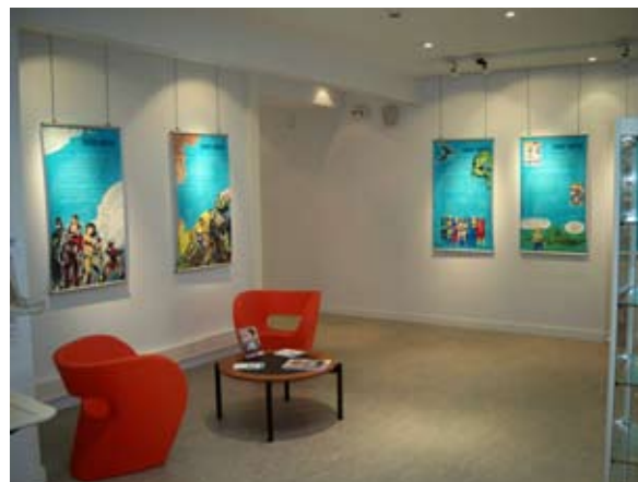
Les Super Héros Médiathèque de St Nazaire (44)