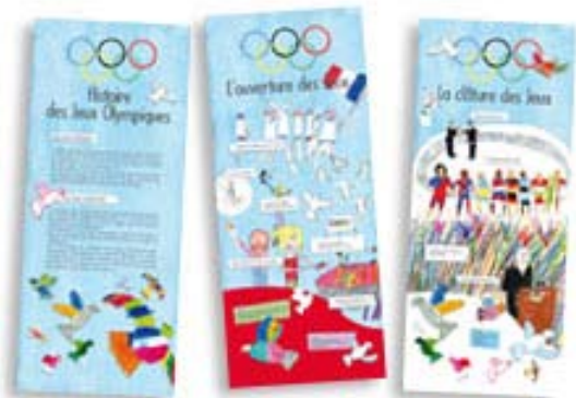
Exposition sur Les Jeux Olympiques BDP Meuse (55)

Commande de la Bibliothèque Départementale de Prêt de la Meuse d'une exposition de 8 panneaux réalisée avec plusieurs classes de Primaire puis validée par le Comité Olympique