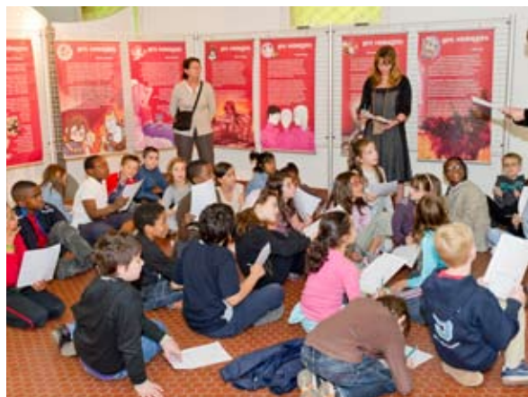
Les Mangas Médiathèque de Livry Gargan (93)