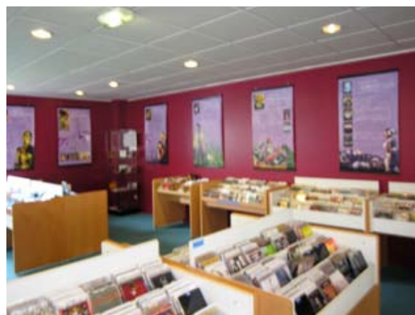
Le Cinéma Fantastique Médiathèque de St Priest (69)