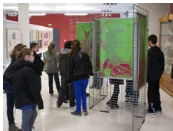
Fables de La Fontaine Médiathèque d'Onnaing (59)